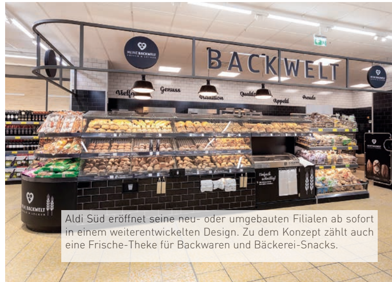
Aldi Süd eröffnet seine neu- oder umgebauten Filialen ab sofort in einem weiterentwickelten Design. Zu dem Konzept zählt auch eine Frische-Theke für Backwaren und Bäckerei-Snacks.